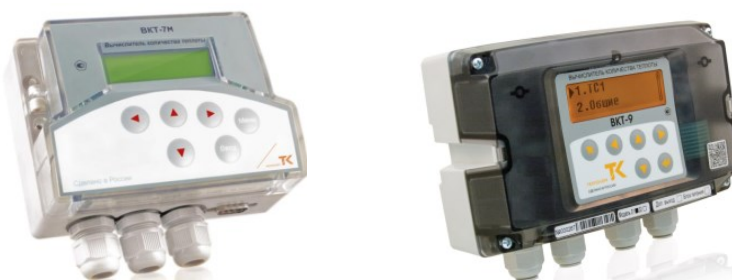
Рисунок 1 – Вычислители количества теплоты ВКТ-7М, ВКТ-9

Общий вид составных частей теплосчетчиков приведен на рисунках 1-5.